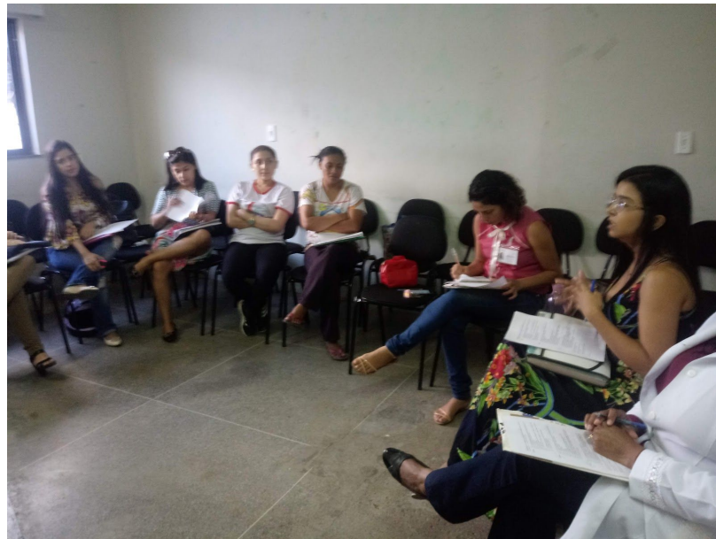
Imagem 1: Apoio Matricial no CSF do bairro Terrenos Novos.

(...) que surgem mas nós temos também aquela organização que é de praxe, fixa, que diz respeito da frequência e a datas marcadas que a gente está no território e ao mesmo tempo a gente também continua à disposição da equipe de outras formas principalmente por telefone que a gente tá resolvendo questões que foram surgindo ao longo da semana e que não dá para esperar até a nossa ida ao território. (Profissional matriciador 1)